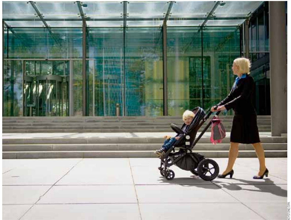
Kadermitglied auf dem Weg zur Kinderkrippe: Manager setzen zusehends Wert auf die Work-Life-Balance.